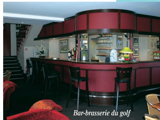
Bar-brasserie du golf