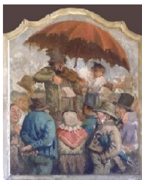
Anonyme, Les marchands de musique ambulants , huile sur bois, coll. Musée municipal d'Avranches