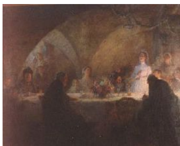
Charles Léandre, La chanson de la mariée , huile sur toile, coll. Musée du château de Flers

Le Musée travaille en partenariat avec l'association La Loure . Fondée en 1998, celle-ci recueille et valorise les chansons, musiques et danses traditionnelles de Normandie par le collectage, l'animation, la formation, l'édition et la constitution d'archives sonores et audiovisuelles.