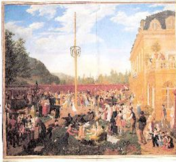
Marie-Joseph Flouest, Fête populaire dans le parc d'un château , huile sur toile, coll. Château-Musée de Dieppe