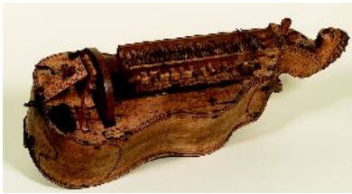
J. Daigremont, vielle à roue, noyer, coll. Musée de Normandie, Caen