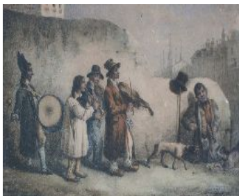
Anonyme, Musiciens ambulants , estampe, coll. Musée du Vieux Granville