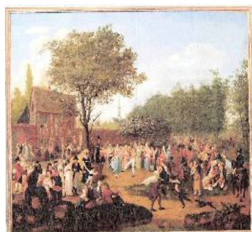
Marie-Joseph Flouest, Fête dans un parc , huile sur toile, coll. Château-Musée de Dieppe