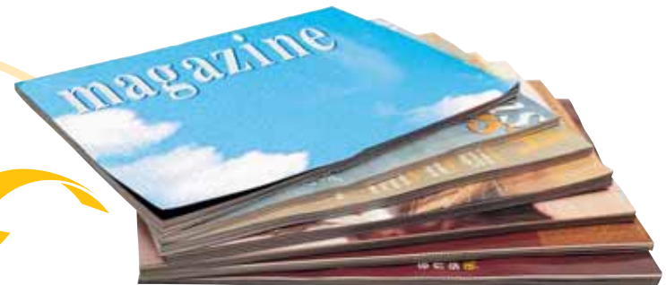
Magazines et catalogues