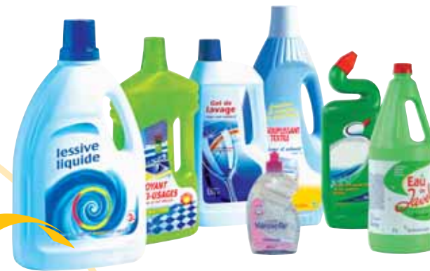
Flacons de produits ménagers