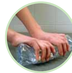
Écrasez votre bouteille (débouchée) à plat.

Oui : vous réduirez ainsi leur volume et faciliterez leur collecte et leur recyclage. Mais, attention : écrasez-les à plat (sur une table, par exemple) et rebouchez-les pour qu'elles ne se regonflent pas.