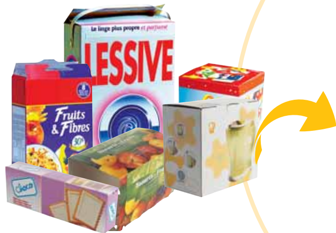
Boîtes et suremballages en carton