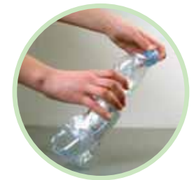
Rebouchez-la. Vous pouvez la déposer dans un bac jaune.