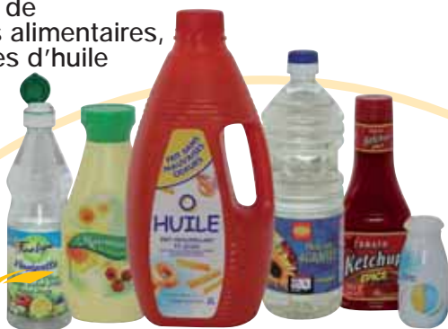
Flacons de produits alimentaires, bouteilles d'huile