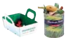
Emballages sales non vidés

Non recyclé > A jeter dans votre poubelle habituelle