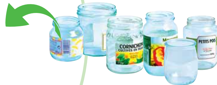
Pots et bocaux