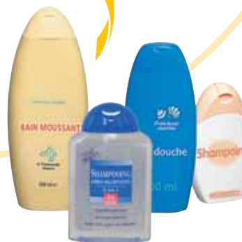
Flacons de produits d'hygiène