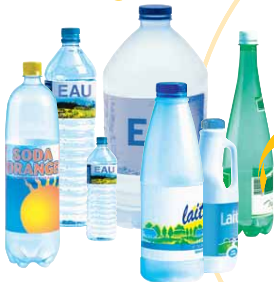
Bouteilles d'eau, de jus de fruit, de soda, de lait, de soupe