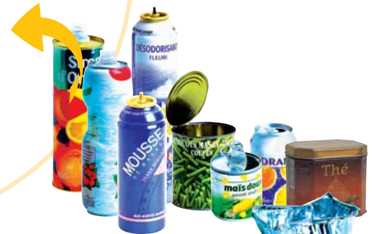
Bidons de sirop, aérosols, boîtes de boisson et de conserve, barquettes en aluminium